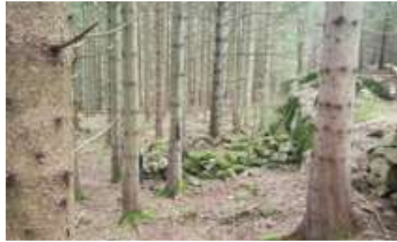
Till vänster: Fram till 1920-talet ökade den odlade arealen, för att därefter gradvis minska. Bilden visar ett uppodlat slättlandskap i Foss i början av 1900-talet. Här ser vi också ett nytt inslag i odlingslandskapet - granplantering. Till höger: Ladugårdsgrunden efter torpet Backen på Skottfjället.

I början av 1900-talet var jordbruket alltså den viktigaste näringen på landsbygden och utöver spannmål blev också andra varor efterfrågade. Efter andra världskriget började det bli vanligare med specialisering inom jordbruket och allt fler gårdar blev spannmåls- eller djurgårdar med enbart foderväxtodling. Utvecklingen påverkade ekonomibyggnaderna på flera sätt. Ladugårdar fick högre höskullar, eftersom ökad mjölkproduktion innebar större foderkonsumtion vilket krävde större lagringsutrymme.