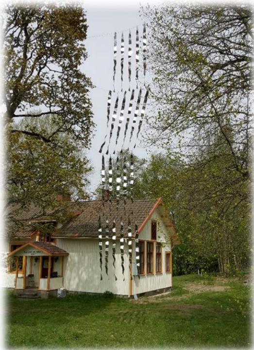
Victor Grachev – Ryssland "Sky river" – Böle, Dals Ed

Mitt verk föddes av en kombination av platsen, materialet och teknologin. När jag var i Ödeborg för första gången i april, blev luften min störta intryck. Högsta punkt i området, är kullen täckt av bronsålderns gravar. I mellan växer en rak björk. Min blick riktade sig till toppen mellan träd och ovanpå det största grav. Där fångas växling mellan graven och himlen, mellan jorden och luften. Sälg är ett lätt böjligt material som och flätades som ett slags luftig nät, inspirerat av spunnet nät som hänger ovanpå graven, upphängd mellan träden. Verket utfört i samarbete med föreningen Södra Valbo Hembygdsförening.