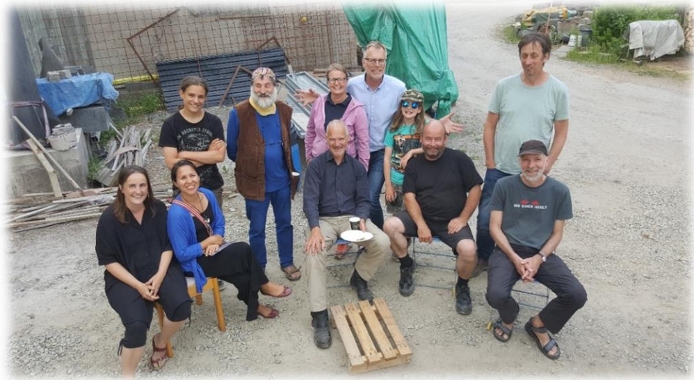
Några konstnärer och projektledning samlade 2018

Vi är nöjda och stolta för att ha rott detta rott detta projekt iland. Det har varit ett givande att arbeta gränsöverskridande. Fantastiskt roligt och att samarbeta med Dals Ed! Inget är omöjligt där! Imponerande! Färgelanda har haft sina förutsättningar och har inte kunnat engagera sig i samma omfattning som vi andra kommuner.