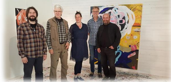
Vernissage Ed och Munkedal