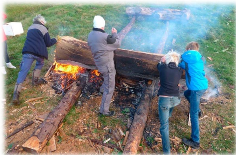
Elever från Hedekasskolan vid "Porten"

I Munkedals kommun genomförde Hedekasskolans åk 8 uppförande av Karl Chilcotts "Porten". Alla kommunens åk 3:or hade workshops i Land Art (april 2020) tillsammans med Bohusläns Museum. En arkeolog och en konstpedagog hade workshops i anslutning till Lökebergs hållristningar utanför Munkedal.