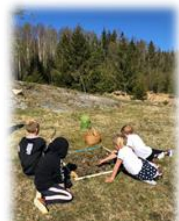
Land Art åk 3 Lökeberg, Munkedal