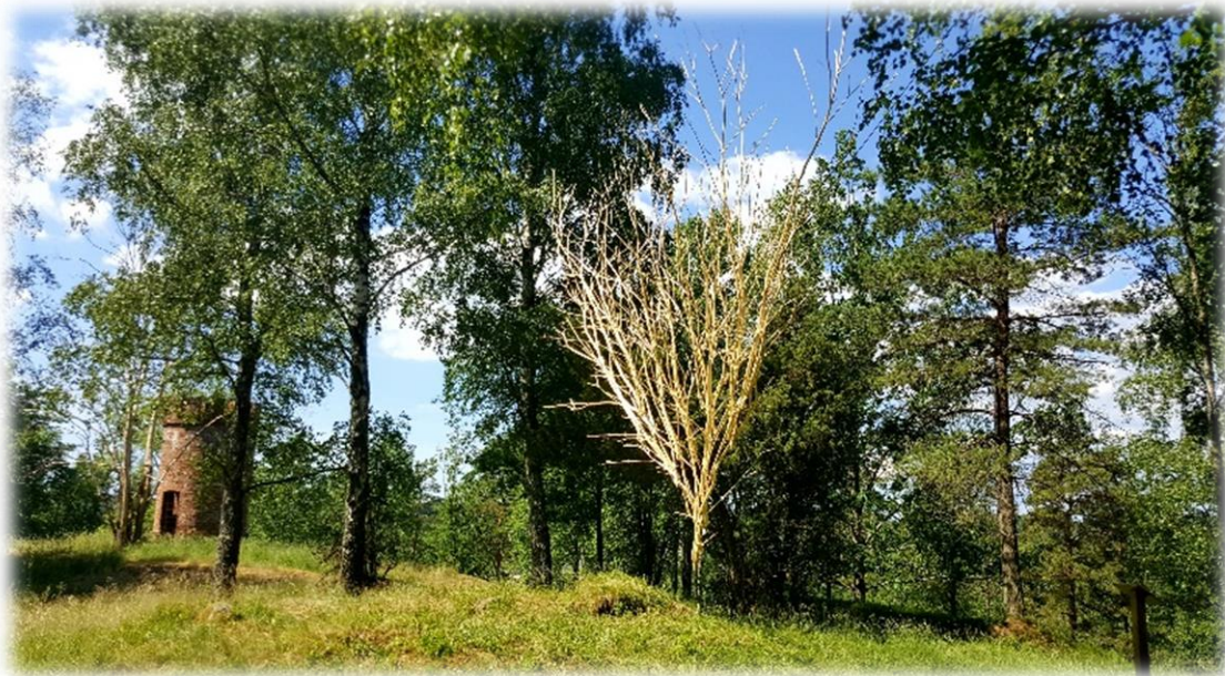
Thierry Godet – Tyskland "Nätet" – Ödeborgs fornsal

Mitt verk föddes av en kombination av platsen, materialet och teknologin. När jag var i Ödeborg för första gången i april, blev luften min störta intryck. Högsta punkt i området, är kullen täckt av bronsålderns gravar. I mellan växer en rak björk. Min blick riktade sig till toppen mellan träd och ovanpå det största grav. Där fångas växling mellan graven och himlen, mellan jorden och luften. Sälg är ett lätt böjligt material som och flätades som ett slags luftig nät, inspirerat av spunnet nät som hänger ovanpå graven, upphängd mellan träden. Verket utfört i samarbete med föreningen Södra Valbo Hembygdsförening.