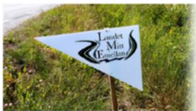
De här skyltarna påminner om och visar vägen till konstverken i Landet mitt emellan.