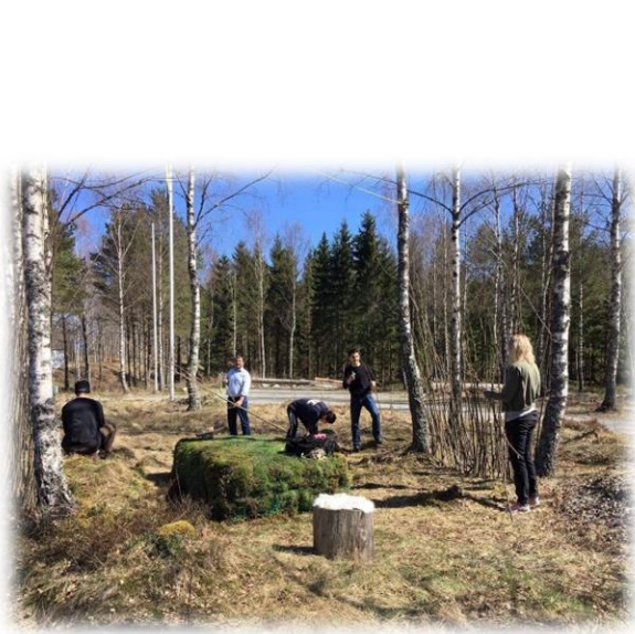
Nyanlända skapar "Gästrummet", Älgparken