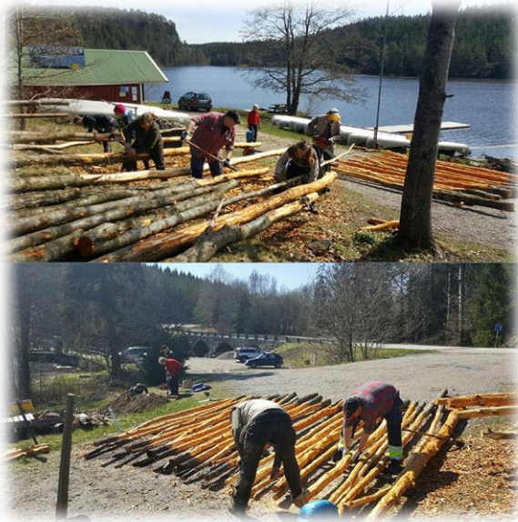
Arbete med "Flottarsaga", Kanotcentralen