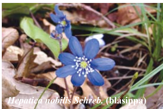
Hepatica nobilis Schreb. (blåsippa)

Fridlysning innebär att det är förbjudet att plocka, fånga, döda, eller på annat sätt samla in eller skada vissa växter och djur. Man får inte heller ta bort eller skada artens frön, ägg, rom eller bo. Både arter som är starkt hotade, och därför mycket känsliga för insamling, och arter som inte är så sällsynta, men populära att plocka eller fånga, kan vara i behov av skydd genom fridlysning. Naturvårdsverket kan fridlysa arter