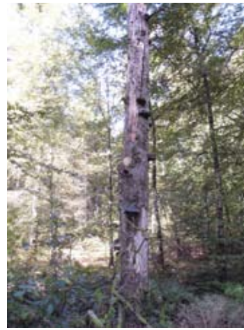
Död ved är en viktig del av mångfalden

Även ett dött träd är ett mycket viktigt substrat för många arter. Olika organismer har olika trädpreferens. Ek har en anmärkningsvärd artrikedom främst med avseende på lav- och vedsvampflora samt skalbaggsfauna. Även gamla aspar har många organismgrupper knutna till sig. Gamla, grova och hamlade askar utgör intressanta miljöer för exempelvis lavar.