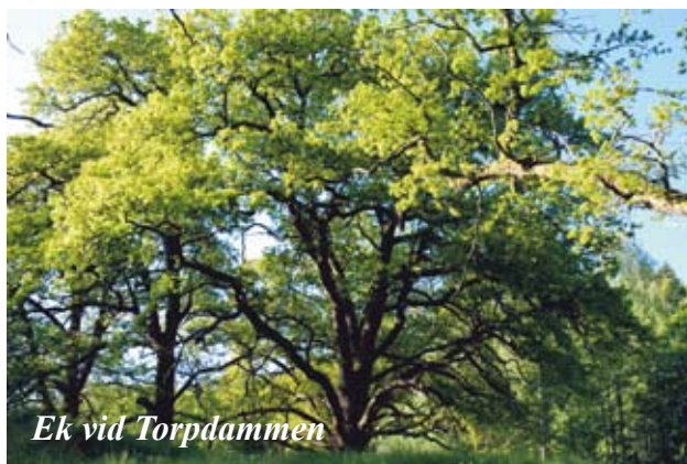
Ek vid Torpdammen

En ekhage kräver hävd annars växer den igen och ekarna dör. Först dör enstaka grenar tills hela träd-et är dött. Ekar som tidigare stått fritt är särskilt sårbara. Sådana områden måste därför röjas upp och hållas öppna. Det bör även röjas runt död ved.