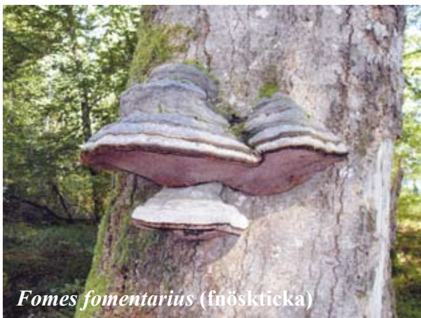
Fomes fomentarius (fnösckticka)

Den biologiska mångfalden förändras ständigt genom naturliga orsaker. Men under de senaste 400 åren har världens biologiska mångfald gått förlorad i en allt snabbare takt. Det är de mänskliga aktiviteterna som är den avgörande orsaken. De viktigaste orsakerna till utdöende sedan 1600-talet har varit överexploatering, till exempel till följd av fångst eller annan jakt, och att inhemska arter missgynnats genom konkurrens eller predation från införda arter. Dessa problem återstår fortfarande för de arter som är hotade idag, men de viktigaste problemen för världens hotade