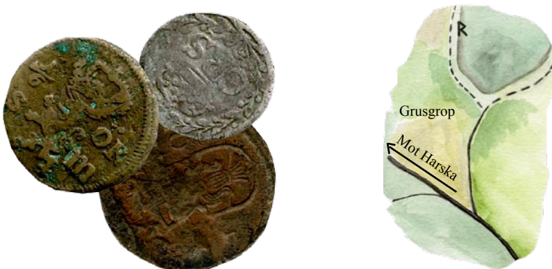
Tre st mynt från 1600-talet, foto ovan ristningen, Erika Eriksson

Numera finns 140 st av mynten i samlingarna på Historiska museet.