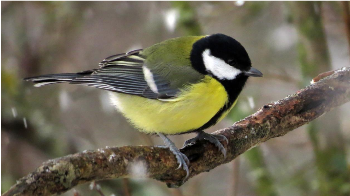
Foton från Sörbygden 08.