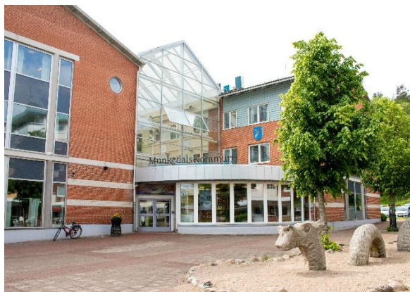
Kommunhuset Forum maj 2018