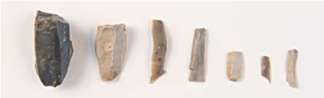
Två mikrospånkärnor och fem mikrospån från jägarstenåldern. Samtliga från Skalleröd.

Redskapens utseende och tillverknings sätt förändrades under hela jägarstenåldern, vilket är grunden för indelningen av tidsperioden och för datering. Liksom Hensbackaperioden har även senare perioder fått namn efter den plats där föremål typiska för platsen påträffats: Sandarna i Göteborg stad och Lihult i Strömstads kommun. Sandarnaperioden sträcker sig ungefär mellan 8 000–6 000 f.Kr. och Lihultperioden mellan 6 000–4 000 f.Kr.