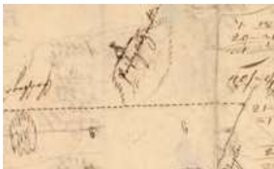
Till vänster: Foss kyrka cirka 1912. Foto: Selma Sahlberg, Bohusläns museums samlingar. Till höger: Vårdkase utmärkt på en karta över gården Berg i Svarteborgs socken år 1712. Lantmäterimyndighetens arkiv.