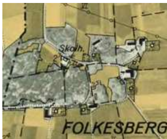
Byn Folkesberg. Kartbilden till vänster visar bebyggelsens placering år 1761. På kartbilden till höger från 1939, efter skiftena, är bebyggelsen utspridd runt berget. Lantmäteristyrelsens arkiv respektive Rikets allmänna kartverk.