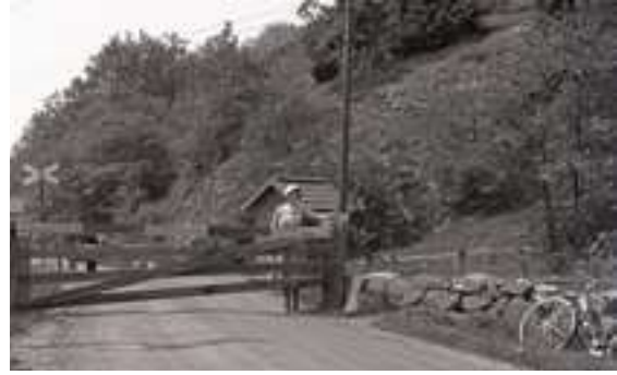
Till vänster: Hällevadsholms järnvägsstation år 1910. Till höger: Järnvägsöverfart med banvakt vid Lilla Foss år 1933.

I Munkedals kommun blev samhällena Munkedal, Dingle och Hällevadsholm hållplatser och knutpunkter mellan järnväg och övrigt resande mot kusten eller inlandet. Järnvägsstationerna drog till sig olika verksamheter och fick en stor betydelse för tillkomsten av samhällena Dingle och Hällevadsholm. I de nya stationssamhällen som växte upp uppfördes järnvägshotell och restauranger som snabbt övertog gästgiveriernas roll. Även området kring Munkedals centrum kan i stort sett helt tillskrivas den betydelse som järnvägen fick under de första decennierna av 1900-talet.