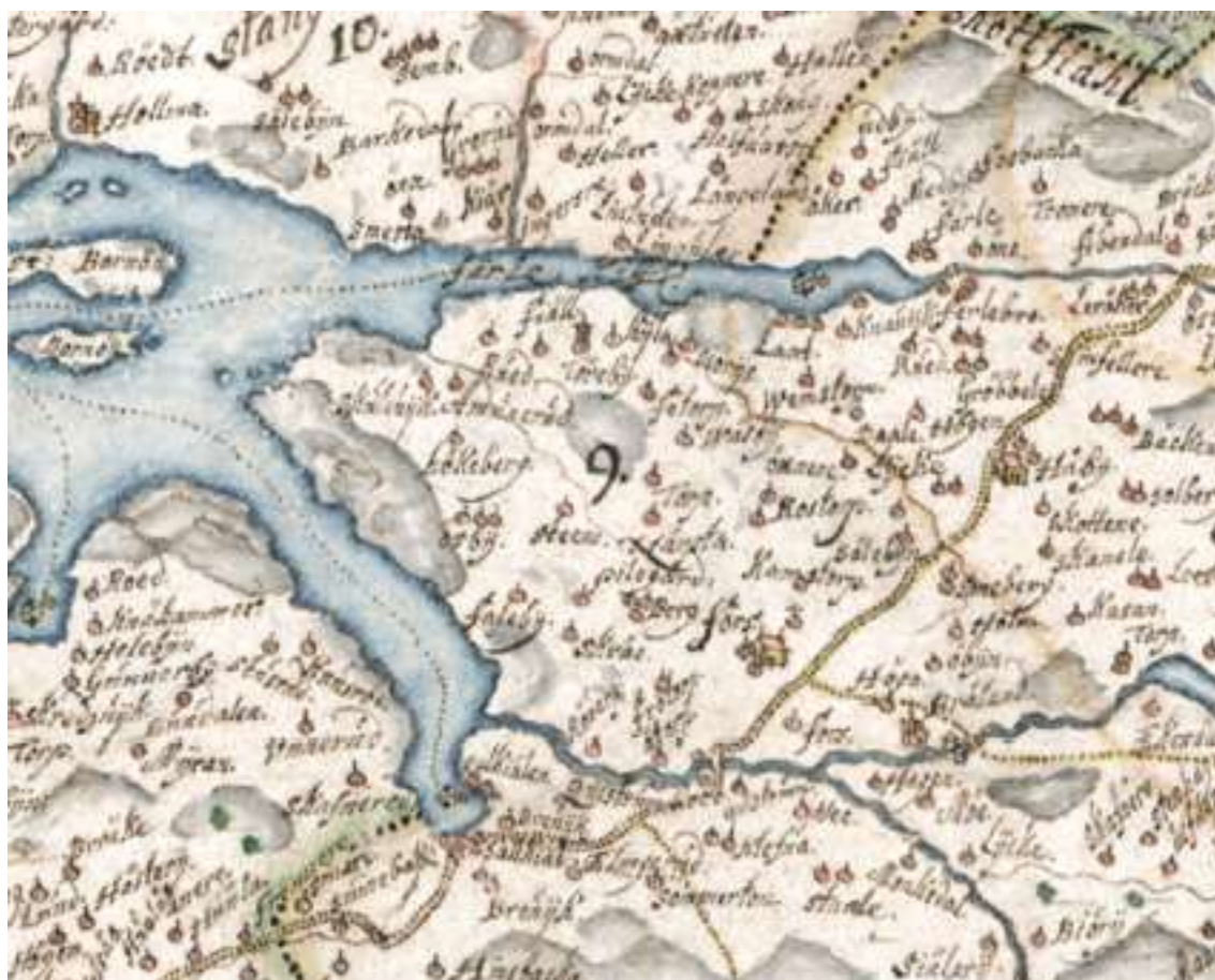
Svenska Lantmäteriet karterade Bohuslän år 1658. Utsnitt.

1657 förklarade Danmark-Norge åter krig mot Sverige och den så kallade Krabbefejden inleddes. Striderna fördes huvudsakligen på de danska öarna men även något i Bohuslän. Bland annat i Kviström där den svenska hären anföll i januari år 1658 och de norska trupperna fick retirera. När den norska förstärkningen kom tågade de norska trupperna ner till Uddevalla och erövrade Uddevalla skans. Ett par veckor senare gick de svenska trupperna över isen på Lilla och Stora Bält och anföll Köpenhamn västerifrån. Kriget slutade med freden i Roskilde år 1658, då bland annat Skåne, Halland och Bohuslän tillföll Sverige.