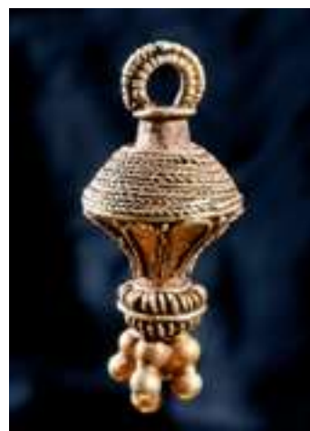
Till höger: Guldblocken från Smedberg.