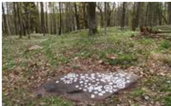
Till vänster: Några av alla skeppen på Lökeberghällarna: De är fotograferade med släpljus i mörker för att ristningarna ska framträda bättre. Till höger: Stenblock med skålgropar mellan gravhögar i Lerberg.