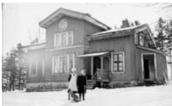
Till vänster: Kviströms gästgiveri med gästgivare och personal omkring 1910. Till höger: Sörbo Gästgivaregård, Krokstad år 1925-30.