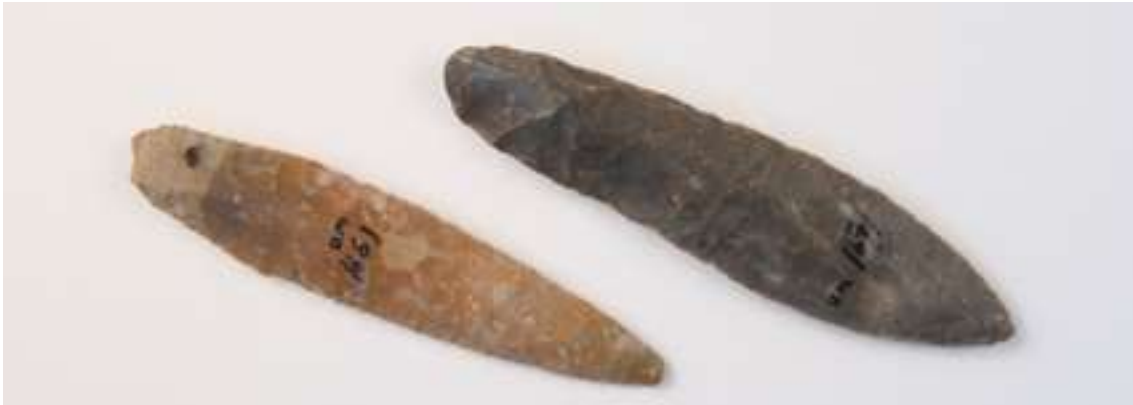
Två lancettdolkar i flinta, cirka 15 cm, från senare delen av bondestenåldern eller äldsta bronsåldern. Den högra, mörkgrå dolken är parallellhuggen. Båda från Röstorp i Foss socken. Bohusläns museums samlingar.

Vid Rödbergets fot intill Saltkällemotet undersöktes år 2006 en boplats som använts under en lång tid. Platsen ligger på 20–25 meters höjd och på bondestenåldern var här ett skyddat läge vid en havsvik i innerskärgården. Under ett 20–60 cm tjockt mörkfärgat jordlager påträffade arkeologerna mörkfärgningar efter stolphål och gropar, tillsammans med rester av härdar och en kokgrop. I jordlagret låg också fynd av keramik och flinta som tidsmässigt gör nedslag i senare delen av bondestenåldern, bronsåldern och hela järnåldern. Kol från en härd, fem stolphål och matskorpan på en bit keramik daterades med hjälp av kol14-metoden som visade en liknande spridning i dateringar.