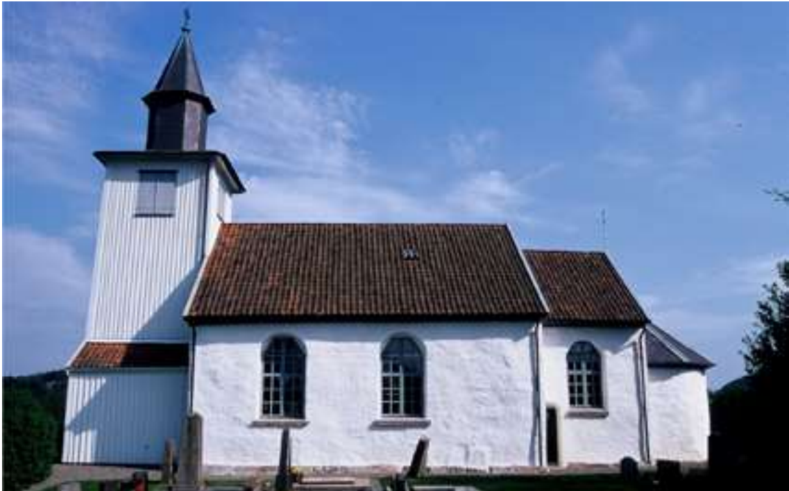
Bärkendals kyrka med torn, långhus, kor och absid.