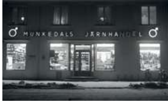
Till vänster: Bertil Karlssons affärsfastighet i Fisketorp, Hede socken, cirka 1940. Foto: Oscar Färdig, Bohusläns museums samlingar. Till höger: Munkedals järnhandel i Artur Hanssons affärs- hus vid Munkedals station 1950-tal. Foto: Oscar Färdig, Bohusläns museums samlingar.