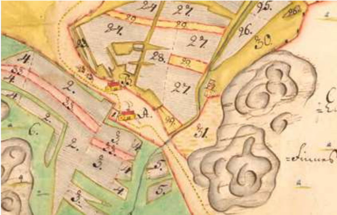
Byn Brevik strax öster om Saltkällan. De grå ytorna är åker, de gröna respektive gula är äng och den beige ytan till höger är utmark. De två hussymbolerna markerar platsen för byns två gårdar. Utsnitt från karta år 1708. Lantmäteristyrelsens arkiv.