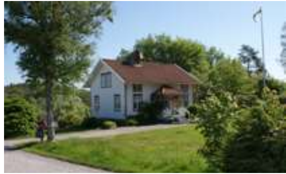
Till vänster: Dubbelhus från 1870-talet på Hålderöd i Krokstad socken med större takutsprång än tidigare och verandor med snickarglädje. Huset har, de för Sörbygden mycket vanliga, lunettfönstren på gavlarna Till höger: Dubbelhus från tiden kring sekelskiftet med tidstypiska korspostfönster och krysspröjsade verandafönster. Bostadshuset på tidigare Kolstorps gård i Hällevadsholm.

Dubbelhusets form i olika varianter användes vid husbygge främst till och med 1930-talet men på vissa håll följde formen med fram till mitten av 1900-talet. Frontespis och takkupor som tidigare förknippades med status blev från 1920- och 1930-talet mer etablerat och när funktionalismen slog igenom på 1930-talet ersattes snickarglädjen med funktionellt utformade detaljer.