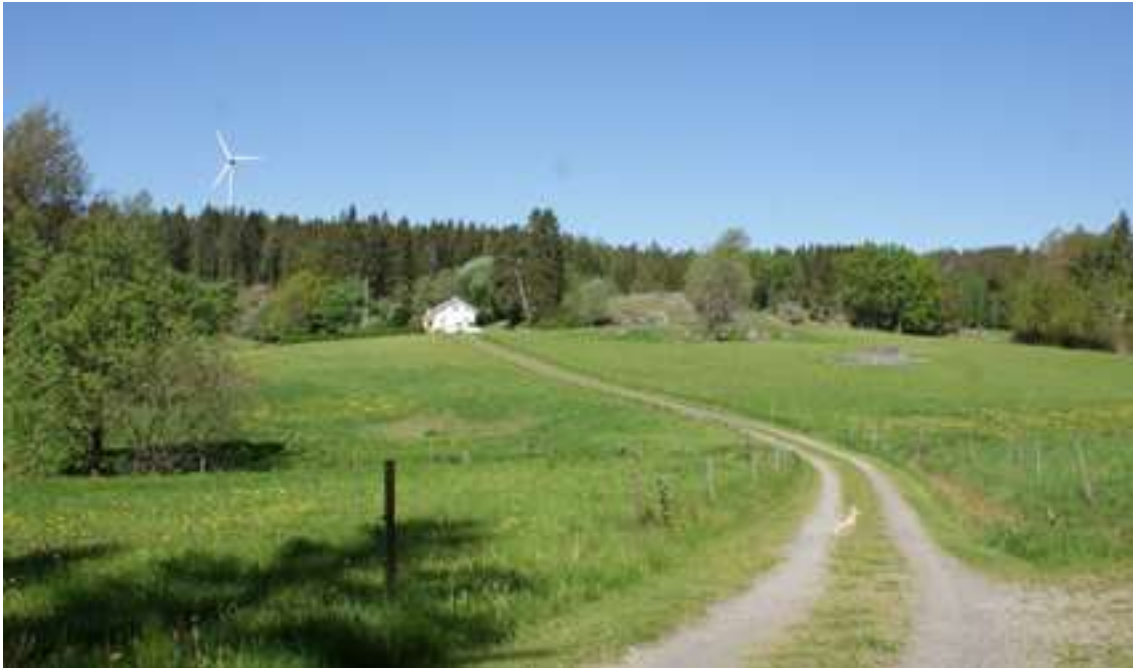
Landskap vid Hermanseröd, norr om Hällevadsholm.