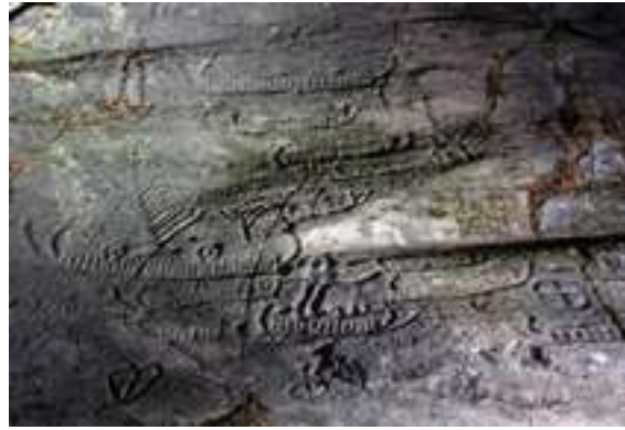
Till vänster: Hällkista vid Hultane nära Sanne. Hällkistan var en grav för flera personer och var i bruk för omkring 4 000 år sedan. Till höger: Skepp, människor och ett träd på Lökebergsristningen på Tungenäset.