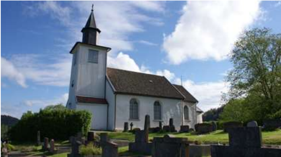
Bärfendals kyrka från 1100-talet. Kristnandet är ett av de viktigaste historiska skeendena.