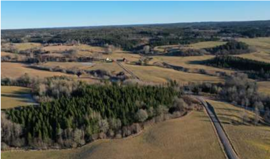
Odlingslandskapet i Örekilsälvens norra dalgång.