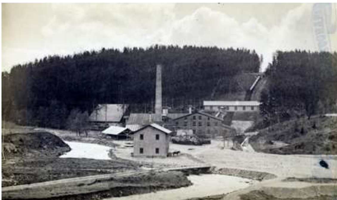
Munkedals bruk år 1880.

1918 såldes Torps sågbruk med underliggande gårdar och vattenfall samt Brålands kvarn och vattenfall. Vid mitten av 1940-talet hade både kvarn- och sågverksrörelsen vid älven upphört. Genom järnvägens tillkomst och elektrifieringen av landsbygden växte nya kvarnar och sågverk upp, oberoende av vattenkraft och flottleder.