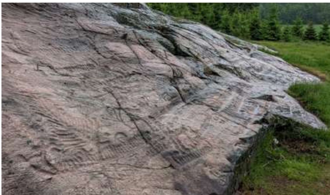
Del av Lökebergsristningarna. I förgrunden, till vänster, är ett träd inhugget.

Till kategorin hällristningar hör även de mer vanligt förekommande skålgroparna. Bara i Foss socken har 1 200 skålgropar registrerats. Den huggna gropen är några centimeter stor och är den allra vanligaste figuren bland hällristningarna. De förekommer på hällristningshällar såväl ensamma som tillsammans med andra figurer. Den runda eller ovala skålgropen är enkel som figur men det är svårt att veta vad den betyder. Frukthetsymbol, solen, månen, stjärnor, droppar, kvinnligt kön, döda människor, kalendrar är bara några av alla tolkningar som har föreslagits.