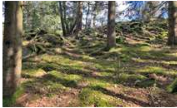
Till vänster: Vy över Buråsareberget. Fornborgen har legat ovanför branten. Till höger: Stenvallar som har spärrat vägen upp till fornborgen på Slottsberge.