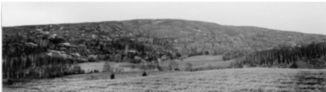
Ett skoglöst Kynnefjäll, Söbbön i Krokstads socken 1923.

Under 1800-talet slopades i stort sett alla förordningar och under dess första hälft minskade den återstående skogen i allt snabbare takt. Kynnefjäll, som lär ha varit kalhugget redan vid 1700-talets slut, beskrivs av Holmberg på 1840-talet som fortfarande lika ödsligt och kalt "...och visar på sin milsbreda rygg anblicken af den hemskaste öken" .