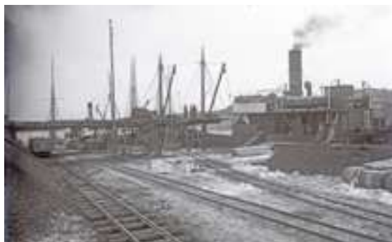
Till vänster: Portvaktsstugan, den så kallade "rundkvisteporten" vid huvudingången till Munkedals bruk år 1910. Till höger: Munkedals hamn i början av 1900-talet.