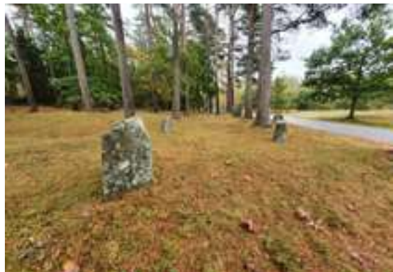
Till vänster: Domarring i Torreby bokskog. Till höger: Skeppssättning på Steneheds gravfält. Båda gravtyperna förekommer på järnåldern och tros vara cirka 2 000–1 000 år gamla.