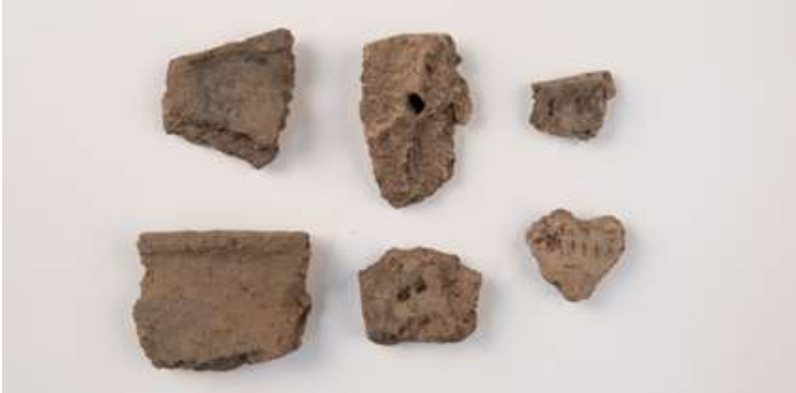
Keramikbitar från bondestenåldern: mynningsbitar, intryckta gropar och streck. Bohusläns museums samlingar.

deras stenkammargravar påträffas även på många andra håll i Västeuropa. Keramiken kallas för trattbägarkeramisk och har hittats bland annat i stenkammargravar. Ibland har det påträffats keramikskärivor med rester av fastbränd mat på skärivorna vilket tyder på att man lagat varm mat i kärlen. Analyser av matresterna har visat vilka växter och djur som maten kom från.