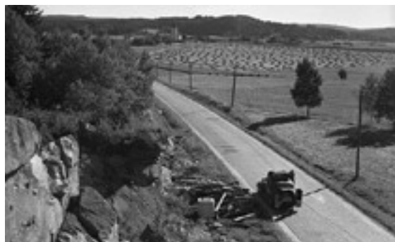
Till vänster: Kviström och bron över Kviströmsälven. Bron är utförd i kallmurningsteknik med kvadersten i tre spann. Foto: Viktor Lundgren mellan 1920-50, Bohusläns museums samlingar. Till höger: Landsvägen mellan Dingle-Håbygård med Håby kyrka i bakgrunden, mellan åren 1940 och 1950. Foto Viktor Lundgren, Bohusläns museums samlingar