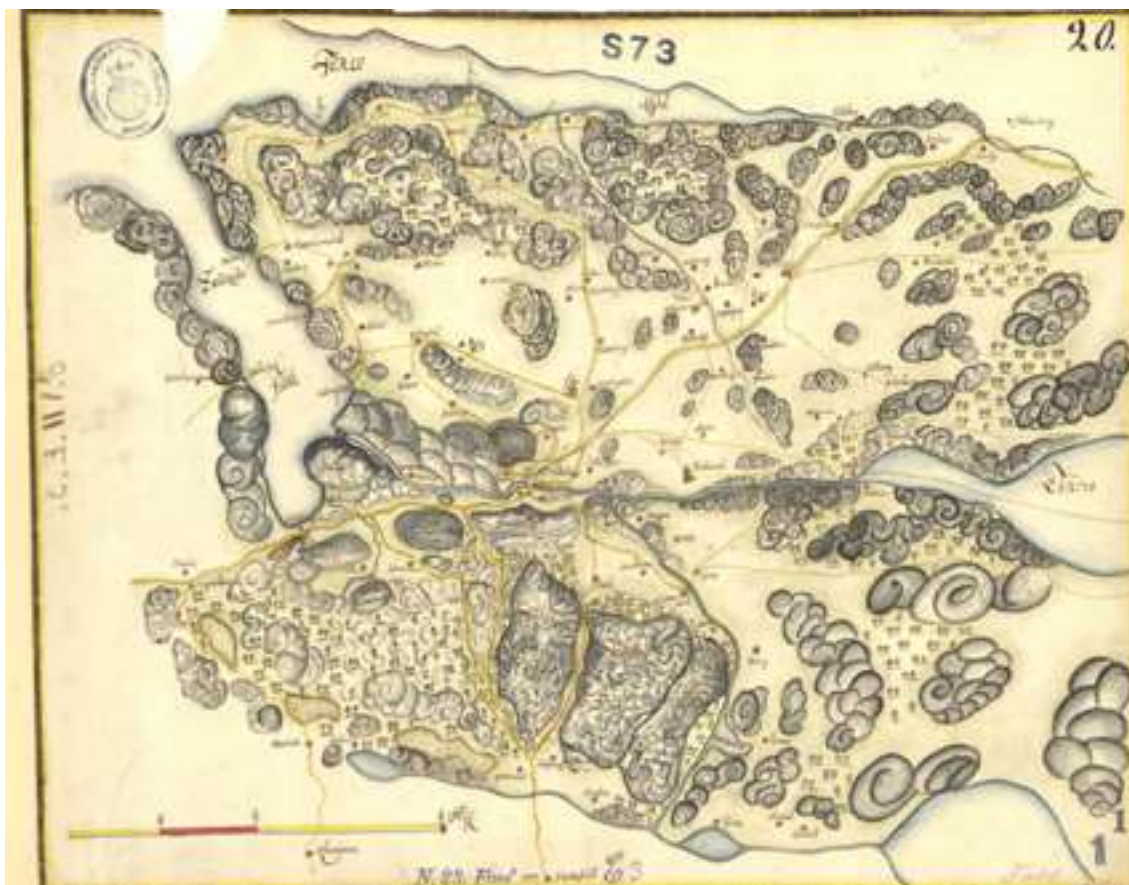
Kungsvägen genom Kviström och vidare mot nordöst. Sockenkarta från år 1686. Lantmäteristyrelsens arkiv.