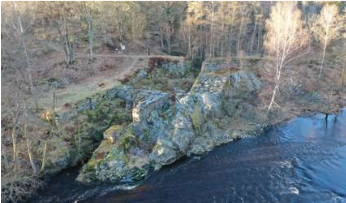
Borgmästarbruket – grunden till den vattendrivna sågen.