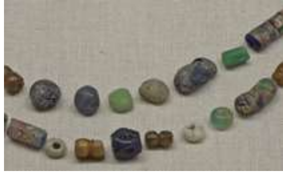
Till vänster: Ett av gravfälten i Håby-Torp. Till höger: Några av de 33 glaspärlorna från Spelehögen.

Munkedals kommun har några av Bohusläns största koncentrationer av stora gravar och gravfält från järnåldern. På en långsmal ås söder om Kärnsjön, mellan gårdarna Torp och Lerberg i Håby socken, ligger ett av kommunens största och mäktigaste gravfält. Här finns ett hundratal synliga gravar från järnåldern. Idag är de uppdelade på sju gravfält men det är möjligt att det förr har varit ett sammanhängande gravfält som under de senaste århundradena styckats upp av vägar och bebyggelse. De flesta gravarna är runda högar i olika storlekar men här finns även domarringar, resta stenar och mäktiga långhögar. En av långhögarna är mycket stor, 40 meter lång och 10 meter bred. Mängden och sammansättningen av gravar tyder på att gravfältet har använts som begravningsplats under hela järnåldern, från år 500 f.Kr. till 1000-talet e.Kr. Jorden på grusåsen var lätt att bruka och bebyggelsen låg troligen i närheten av gravfältet även då.