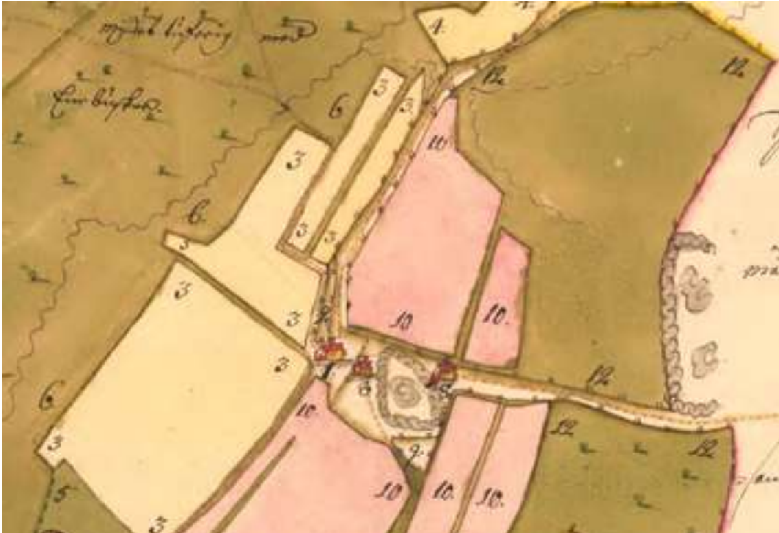
Detalj av karta över byn Smeberg år 1719. Det var första gången byn karterades. Bebyggelsen ligger samlad på ett bergigt impediment mitt i inägorna. De rosa och gula ytorna är åker och de gröna är äng. Norrut från bytomten syns fägatan med hägnader på ömse sidor. Lantmäteristyrelsens arkiv.

Vid medeltidens början ökade befolkningen kraftigt. De bebyggda områdena utökades och förtätades. Ny mark koloniserades i skogsbygderna. Från denna tid finns många Ortsnamn med ändelserna "-röd", "-rud" och "-red", som betyder röjning, samt "torp", som betyder utflyttargård.