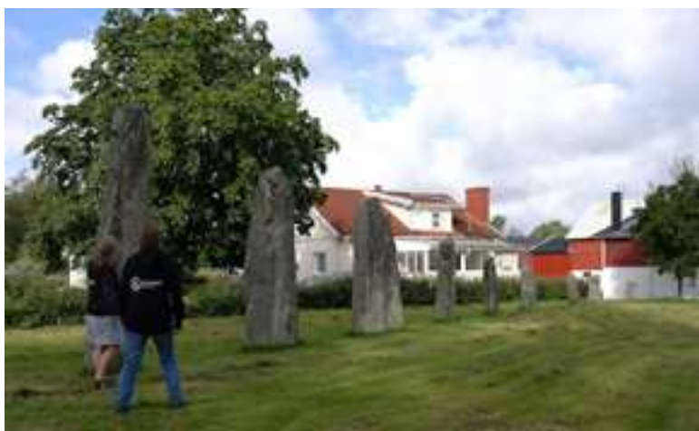
Till vänster: Bautastenarna på Stenehed.

Arkeologer brukar se på gravar som heliga eller kultiska lämningar medan boplatser ses som spår av vardagen. Men ibland är spåren från de sakrala och vardagliga företeelserna svåra att skilja åt för våra nutida ögon. Ett svårtolkat exempel är det så kallade "Monumentet" vid Medby nordväst om Dingle, som undersöktes år 1998. Det var en märklig anläggning som då saknade känd motsvarighet. "Monumentet" var 37 gånger 34 meter stort och bestod av en stensatt vall runt ett ovalt berg och en stenpackning som täckte delar av berget. Här fanns spår efter såväl gravar som bosättningar och inte minst ett stort antal härdar. Under delar av stenpackningen fanns även hållristningar och kol14-dateringar på olika ställen i anläggningen gav dateringar från bronsålder till medeltid. Arkeologernas hypotes är att platsen sannolikt har varit viktig redan innan "Monumentet" anlades och att den uppfördes av en elit som genom anläggningen ville stärka sin ställning under en tid med stora samhällsförändringar.