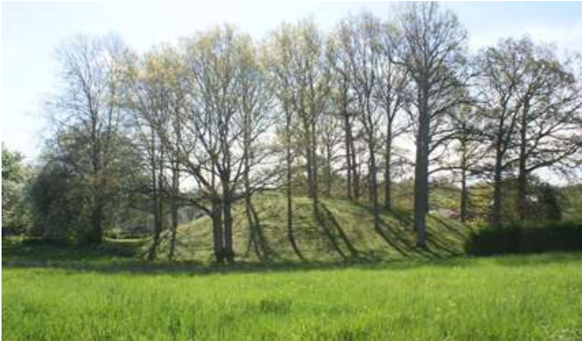
Förhistorien finns mitt inne i dagens samhälle. Tjuvehögen vid Hagarne Ringväg i Munkedal är en av Bohusläns största gravhögar.