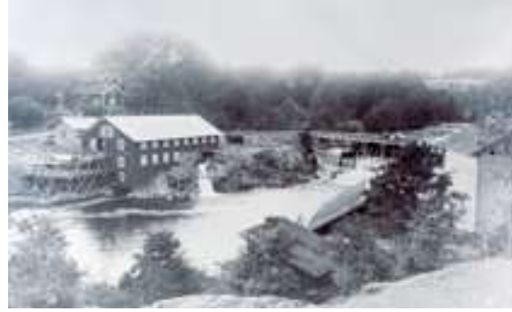
Till vänster: Timmer i Örekilsälven omkring åren 1920-30. Järnvägsmuseet, digitaltmuseum.se . Till höger: Borgmästarbruket omkring år 1918. Foto: Selma Sahlberg, Bohusläns museums samlingar.

ytterligare. Den intensiva sågbruksindustrin från 1600-talet och framåt gav också en del inkomster i form av flottningspengar och körlöner. Frakten för en tolfte timmer kostade på 1600-talet uppköparen mer än själva inköpet av den.