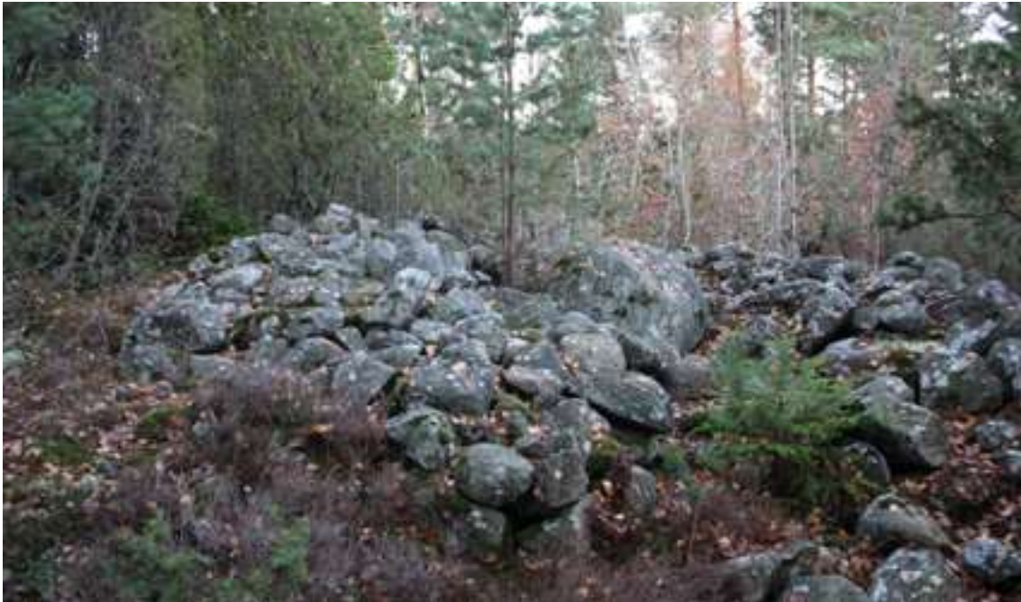
Röse vid Apelviken, Torreby. Idag ligger det lite dolt bland träden men på bronsåldern var det sannolikt synligt på långt håll.