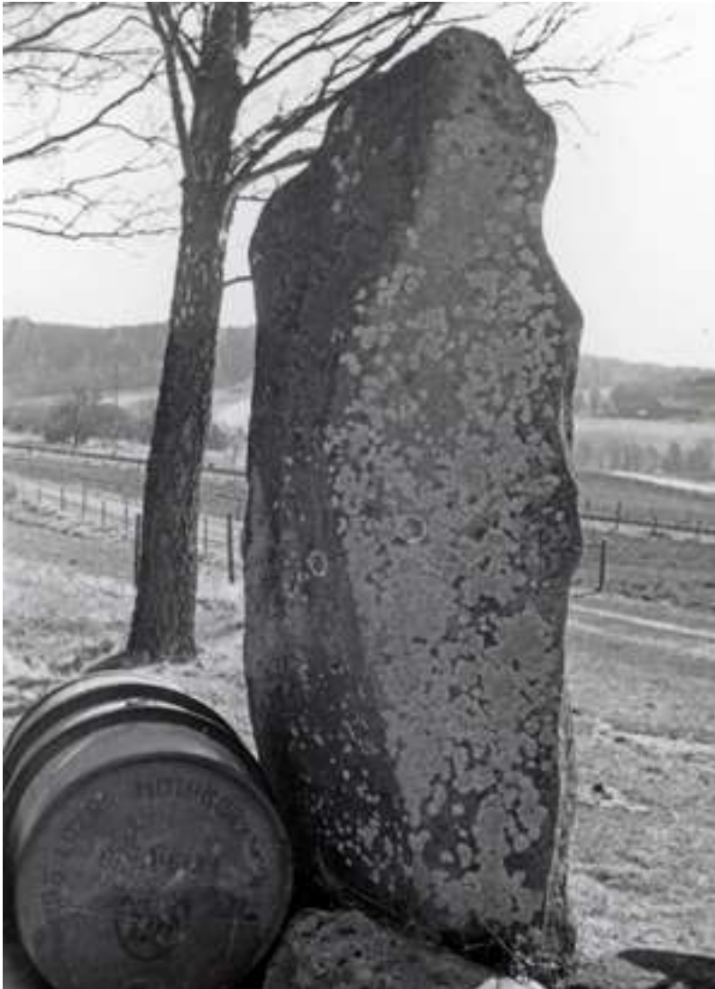
Drottningstenen. Enligt sägnen ligger drottning Hud begravd vid gården Hud strax söder om Huds moar och den så kallade Drottningstenen sägs markera graven.