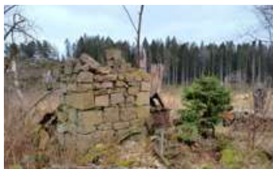
Till vänster: Torpet Gränsen, som tidigare låg under Brattönsgård i Hede socken. Bostadshus och ladugård uppfördes 1936 med förmånliga statliga lån och tillhör därför gruppen "Per-Albin torp". Till höger: Resterna av torpet Dammen under Skörbo i Bärfendal. Spisröset sticker upp och bakom står en äldre vedspis.