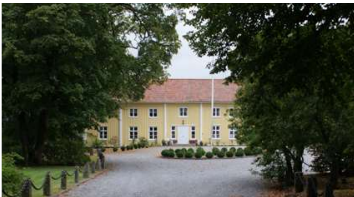
Herrgården på Torreby vars manbyggnad är från 1730.

Kungliga släktingar, andra adelspersoner och framför allt de som varit militärt