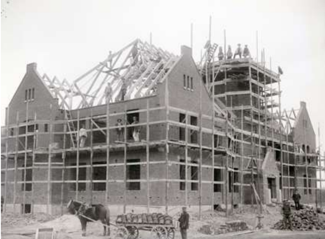
Tingshuset i Kviström byggs år 1917.