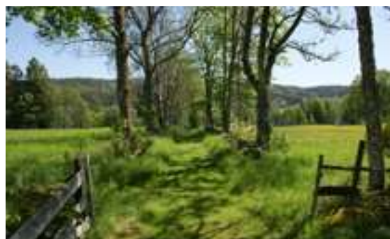
Till vänster: Stenmur vid torpet Ekeskogen på Skottfjället. Foto: Cecilia Wingård, Bohusläns museum. Till höger: Fägata vid gården Hökårr vid Södra Bullarsjöns västra strand. Foto: Cecilia Wingård, Bohusläns museum.