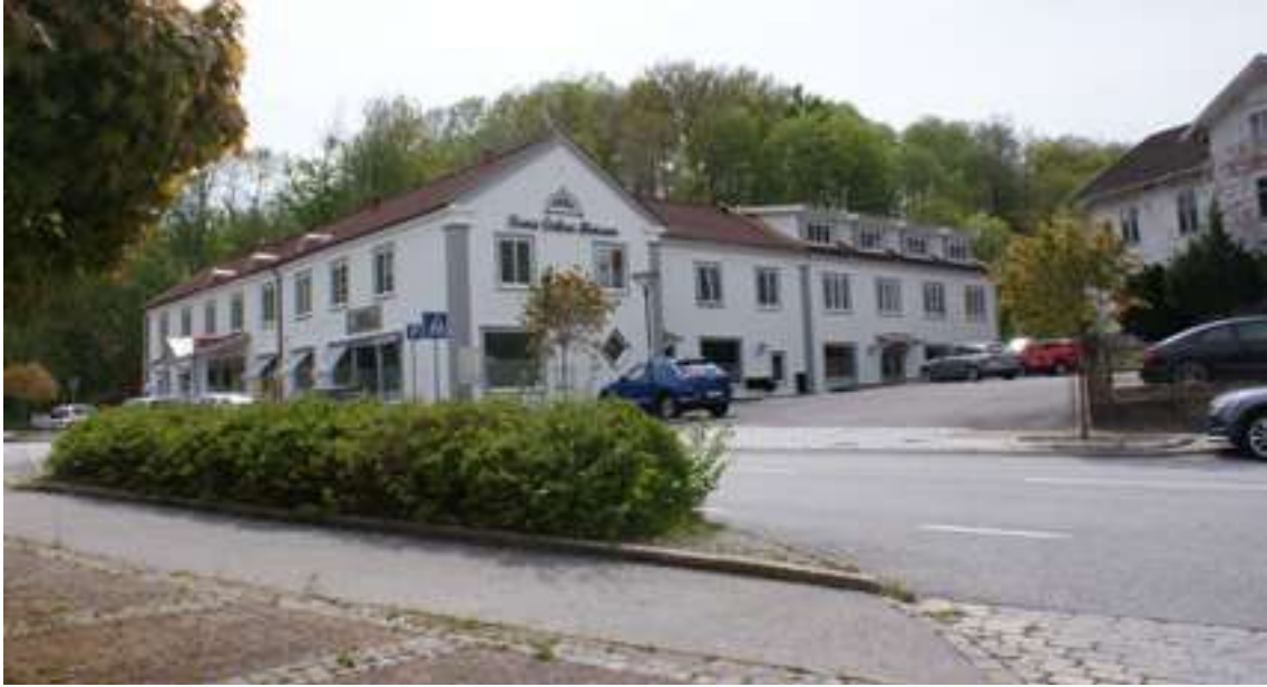
Bebyggelsen kring Munkedals station härstammar från början från 1900-talet och speglar Munkedals framväxt som centralort och kommuncentrum.