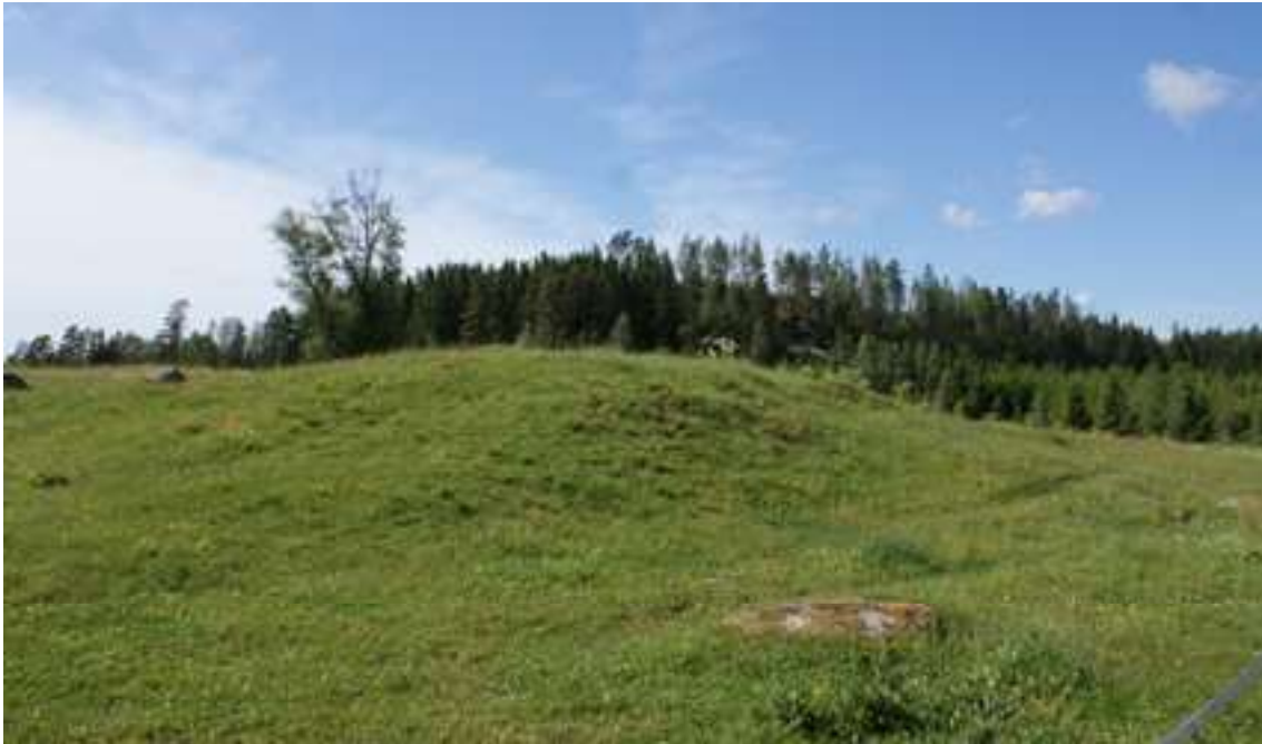
Gravhög vid Torp i Hede socken.