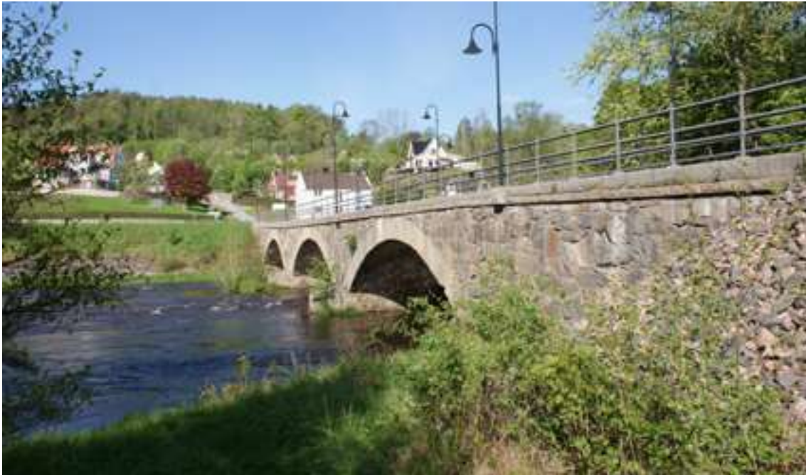
Kviströms bro år 2022.