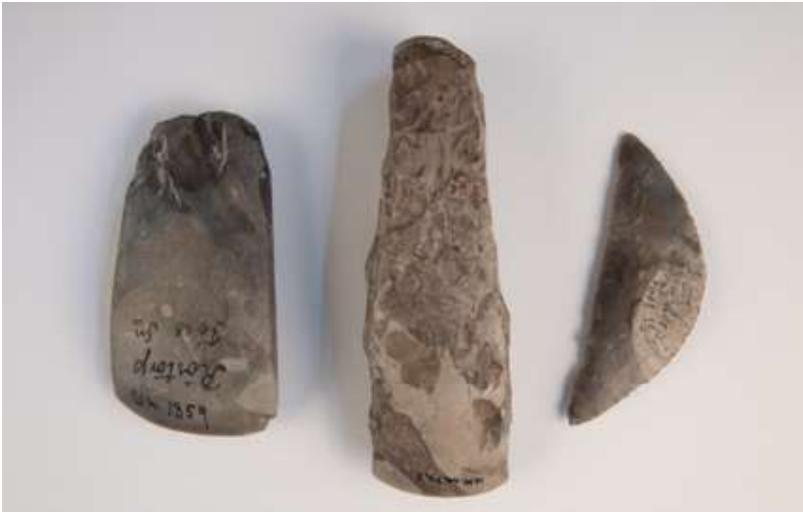
Flintyxor och skära från bondestenåldern. Från vänster: en tunnackig yxa, en tjocknackig yxa och en skära från Foss socken. Bohusläns museums samlingar.