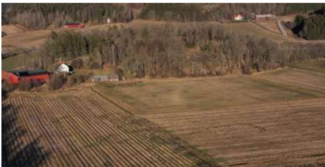
Till vänster: På bergshöjden vid gården Medbo, rakt fram i bild, låg under järnåldern en stor boplat. Den undersöktes 1998.

Synliga lämningar av järnålderns gravar finns överallt runt omkring oss i landskapet. Gravhögar, stensättningar, resta stenar och domarringar är vanliga gravformer. Oftast ligger de samlade i små eller stora gravfält. Det kan finnas flera begravingar i samma gravanläggning och gravar och boplatser kunde finnas på samma plats. Bland annat vid Munkedalsmotet har det legat en plats med ett hus från äldre bronsålder, en smedja från yngre järnålder och flera gravar från äldre järnålder och vikingatid.