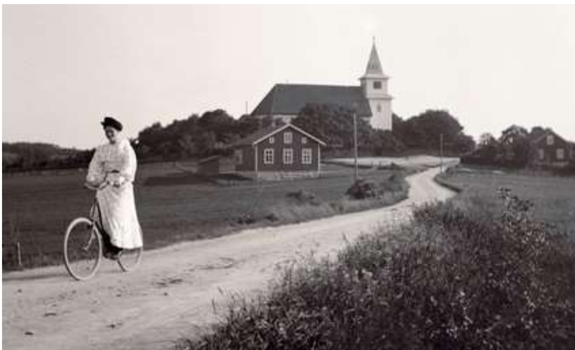
Foss kyrka med sockenstugan framför. Till höger ligger kyrkskolan som var i drift tills omkring år 1960. Den var också lärarbostad.

År 1862 utfärdades en kunglig förordning om kommunalt styre i landet. Den föreskrev att varje socken skulle utgöra en landskommun och att sockenstämman skulle ersättas av kommunalfullmäktige. Från slutet av 1800-talet och fram till 1971 var det också vanligt att tätorter på landsbygden inrättades som municipalsamhällen. Dessa var skyldiga att ansvara för tillämpningen av stadsstadgorna oberoende av den omgivande lands-