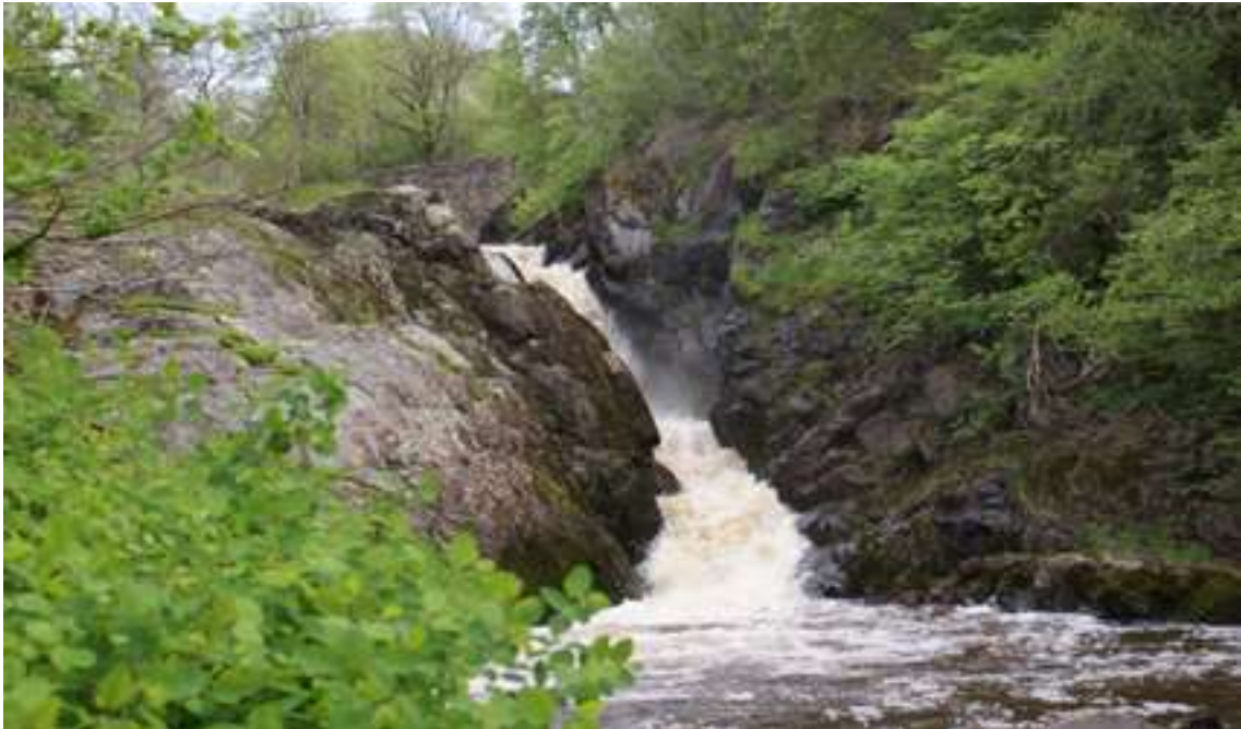
Fallet vid Munkedals bruk.