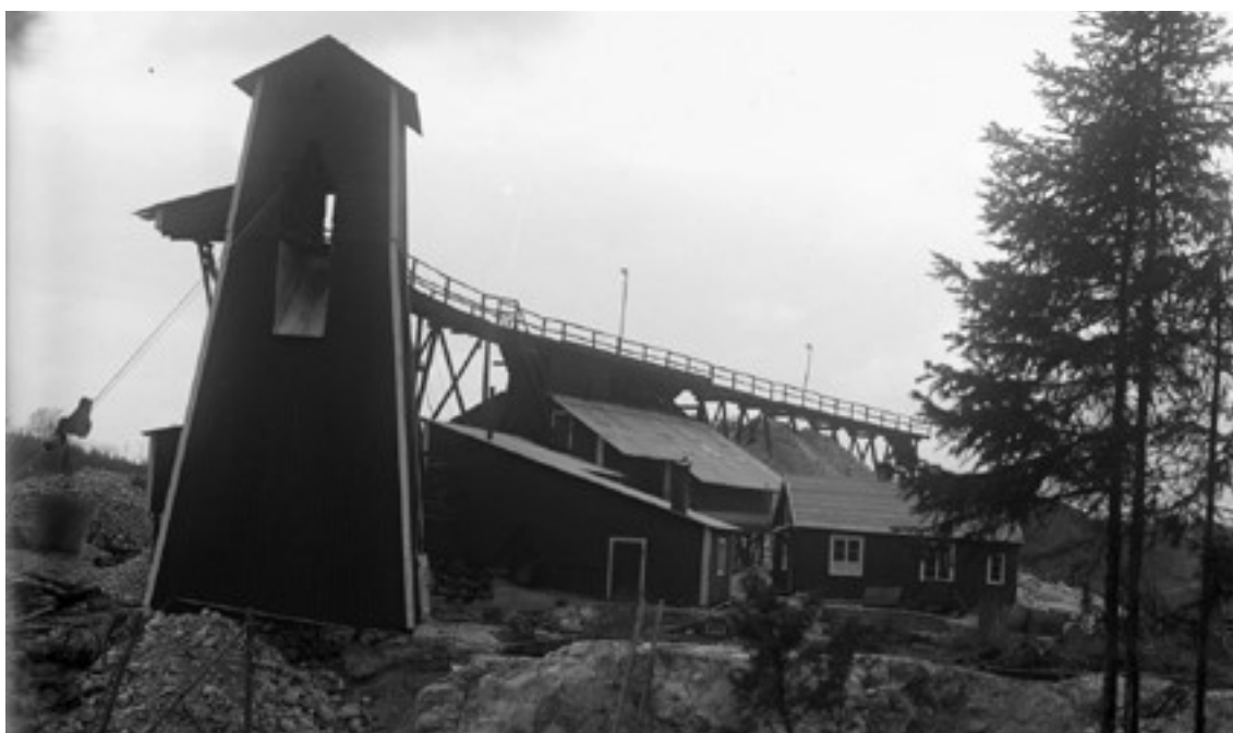
Barhults gruva när verksamheten var igång.

Andra exempel är Vågsäter med kvarn, järnverk och andra vattenkraftsdrivna verksamheter. Det hade även Brattönsgård men där var det ett tegelbruk istället för järnbruk.