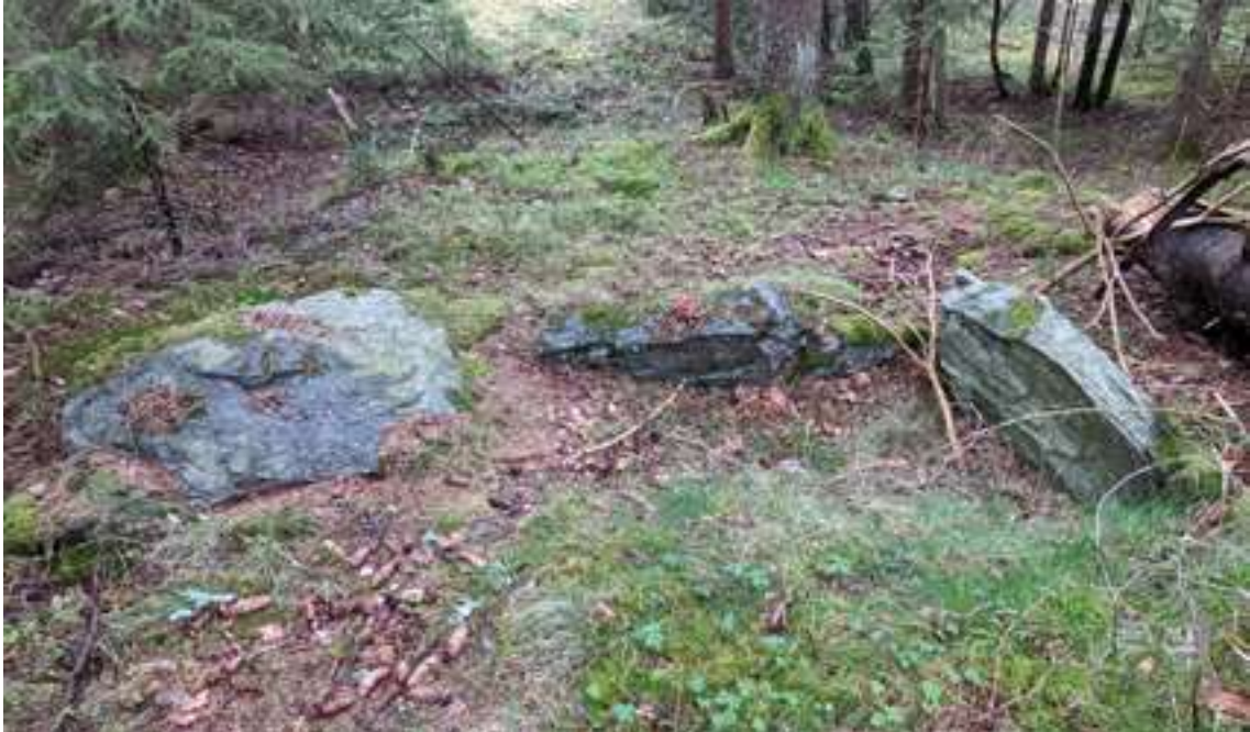
Hällkistan i Röd. Kistan har legat i mitten av en stensättning där stenar rasat eller plockats bort. Två av vägghällarna och eventuellt en takhäll är nu är synliga.

Två av dem ligger på Tungenäset, varav den ena är flyttad till sin nuvarande plats efter undersökning. Hällkistan i Röd på sydvästra Tungenäset ligger i mitten av en stensättning där stenar rasat eller plockats bort så att hällarna nu sticker upp. Vid Hogen, cirka en kilometer sydöst om Gläborg i Håby, är den ena långsidan synlig, bestående av två kantställda hällar. Nära Linneröd sydöst om Hedekas finns en hög med synliga delar av en hällkista. Strax öster om Hedekas samhälle ligger en hällkista med namnet Gälhusommen, den består av delvis dubbla vägghällar och ligger i en 13 meter stor rund hög. Söder om Sanne, mellan Sannesjön och Lersjön, finns en hällkista som har undersökts. Även den är uppbyggd av stora stenhällar och har varit gravplats åt flera personer. I kistan hittade man brända ben samt gravgåvor i form av två flintdolkar, en spjutspets, en skrapa och keramik.