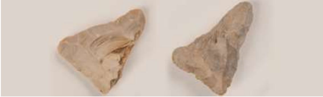
Skivvyxor från Svarteborg respektive Småröd. Bohusläns museums samlingar.