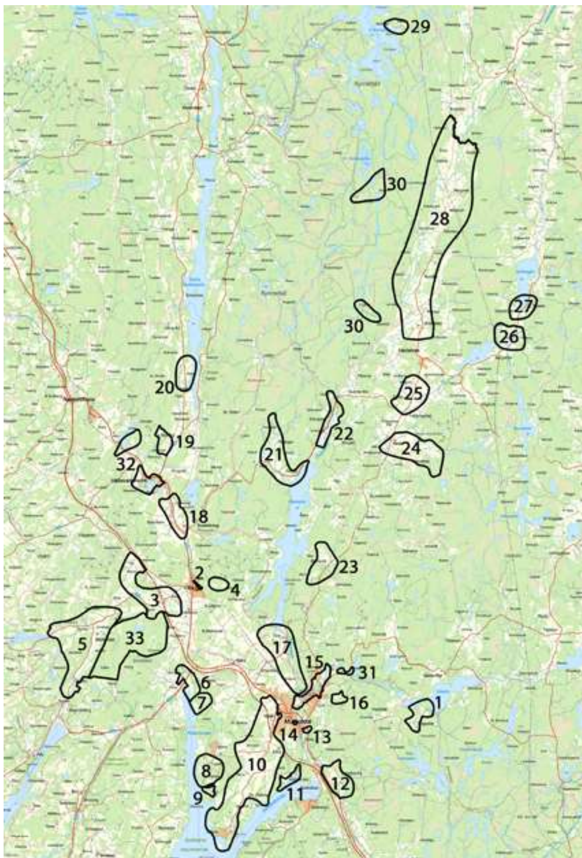
Illustration: Översiktskarta med alla miljöerna