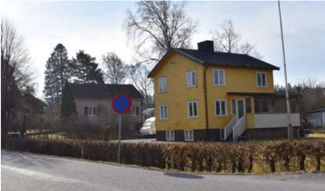
Bebyggelse från 1950- och 60-tal utmed Gamla vägen i Hällevadsholm med mexitegel och eternitplattor.

anläggningar byggdes också på allt fler ställen. Renodlade sommarstugeområden började också byggas bland annat på Tungenäset och vid Saltkällan. Parallellt med denna utveckling skedde en utflyttning från kusten och landsbygden, och från 1950-talet kunde därför lediga torp, smågårdar och hus på landsbygden köpas av sommarboende.