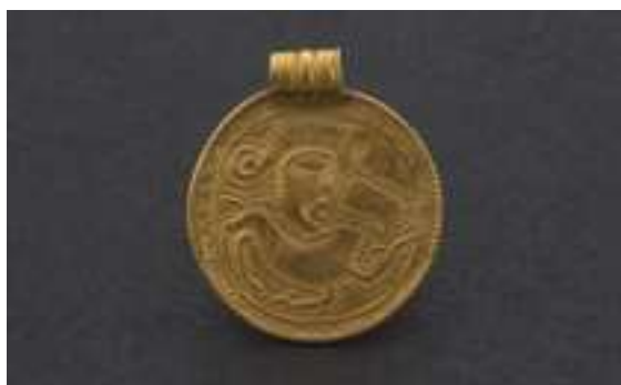
Till vänster: Medaljongen som hittats vid Svarteborgs prästgård. Till höger: Brakeaten från Keberg i Bärfendal. Statens historiska museer.