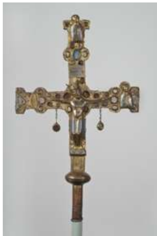
Till vänster: Stensulptur av täljsten från Svarteborgs kyrka. Den helige Olof sitter i en tronstol och bär livbälte, mantel och en murkrona på huvudet. Bohusläns museums samlingar. Till höger: Processionskrucifix från Bärfendals kyrka. Statens historiska museum.