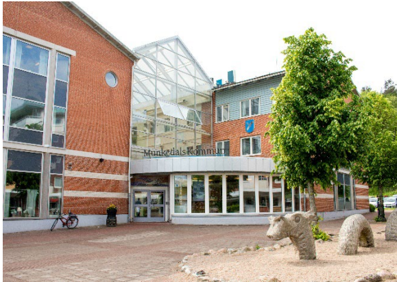
Kommunhuset Forum maj 2018, fotograf Erland Pålsson