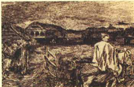
Harald Gille slår läger vid Färlev.

Striderna började med att en irländsk äventyrare, Harald Gille, kom till Norge och uppgav sig vara bror till Sigurd Jorsalafar. Han bevisade sitt släktskap genom järnbörd, d.v.s. att hålla ett hett järn i händerna utan att bli bränd. Tvärtemot vad han lovat Sigurd före dennes död lät Harald utropa sig till kung över halva Norge. Sigurds rättmätige son Magnus gjorde dock motstånd mot inkräktaren.