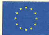
Illustration och layout: Charlotta Hognert 2006