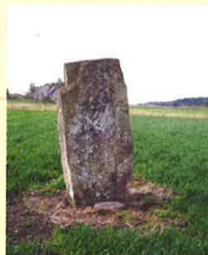
Stenen kan vara rest efter slaget vid Färlev 1134

varit präst eller diakon. Också han uppgav sig vara bror till Sigurd Jorsalafar . Han mördade Harald Gille 1136 då denne blev överraskad hos sin frilla. Sigurd Slembe planer på kungatronen korsades då Harald Gilles två minderåriga söner Inge och Sigurd utropades till samkungar. Sigurd Slembe befriade då istället Magnus Blinde ur klostret och stödde hans sak mot bröderna.