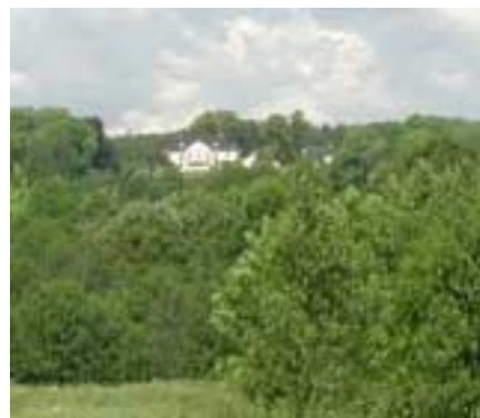
Hensbacka från söder

Hensbacka beskrivs i Holmbergs historiebok från 1840-talet som ”väl bebyggd för ståndspersoner, med herrligaste utsigt åt Gullmarsfjorden samt dalgången åt Skredsviks socken, hvarest landsvägen framgår”. Gårdens läge är väl valt med tanke på dess långa kontinuitet som boplatser. På åkrarna kring gården har man funnit boplatser från den äldre stenåldern. Dessa har gett namn åt den så kallade Hensbackakulturen, vilken är välkänd inom arkeologin.