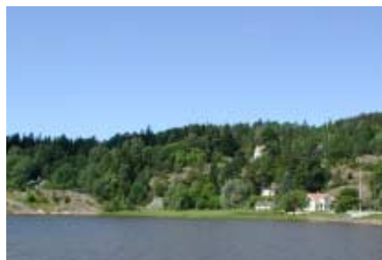
Bebyggelse väster om hamnen

Munkedals hamn är en av de miljöer som är utpekade som värdefulla i kommunens kulturminnesvårdsprogram. Det är en plats med traditioner där kulturvärdena idag är knutna till områdets funktion som en ändstation för Munkedals järnväg. Även om mycket av områdets hamnkaraktär har gått förlorad är egnahemstraditionen, husens gruppering samt enstaka byggnader och anläggningar viktiga för miljön.