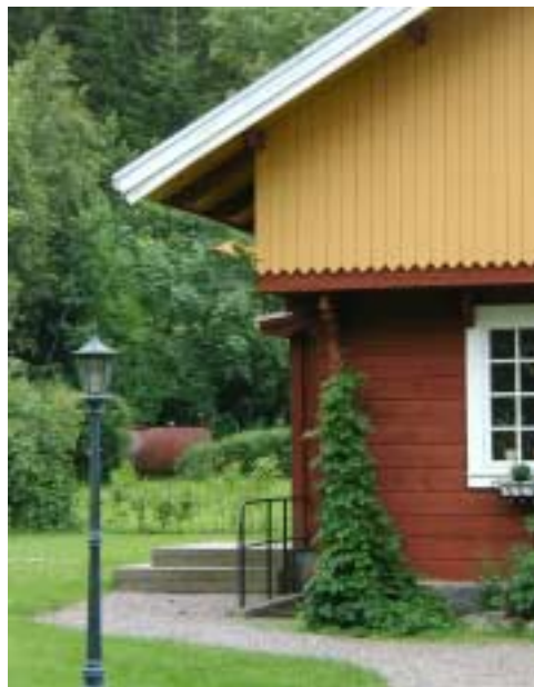
Porten, vid infarten till Torreby, är ett fint exempel på den byggnadsstil och färgsättning som är typisk för Torreby.

Det kulturhistoriska värdet består i Torreby av den sammantagna bebyggelse- och landskapsbilden med en säregen och till stora delar välbevarad bebyggelse. Detta har gjort att området utpekats som en värdefull kulturmiljö i kommunens kulturminnesvårdsprogram. I programmet sägs att det är angeläget att bevara de karaktäristiska byggnaderna i ursprungligt skick och att natur- och kulturmiljön som helhet vårdas.